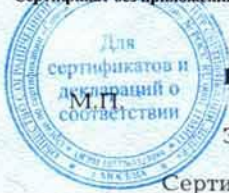
Схема сертификации № 3. Сертификат без приложения не действителен.