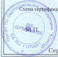
Схема сертификации: З