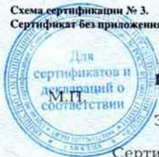
Схема сертификации № 3. Сертификат без приложения не действителен.